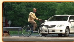
ダイジェスト篇 (約3分)